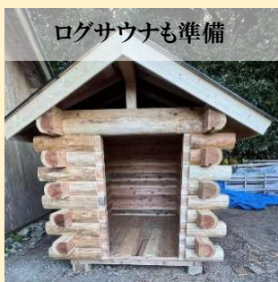
ログサウナも準備

テントサウナのレンタル希望の方はSAUNA TRIP さんで予約するとフレグランスプレゼント！ レンタル予約完了後、「SAUNA TRIP公式サイト」のLINE相談もしくはお問い合わせフォームより ①ご予約のお名前 ②海風サウナ&キャンプ をお伝え下さい。→ https://saunatrip.jp/