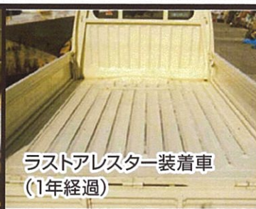
ラストアレスター装着車 (1年経過)