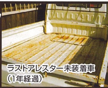
ラストアレスター未装着車 (1年経過)

微弱電流を車体に流し、塗装の硬度を上げて強化し、サビの侵食を防ぎ、ボディ全体を守ります。