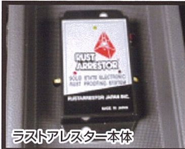
ラストアレスタ本体